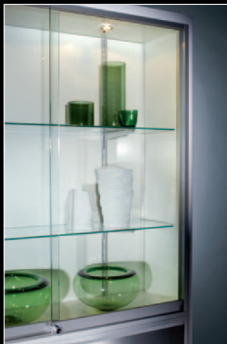
3 Presentación atractiva de productos