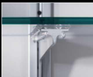
1 Perfiles de soporte para cremallera

3 Presentación atractiva de productos para instalaciones de gama alta en comercios o ferias de muestras.